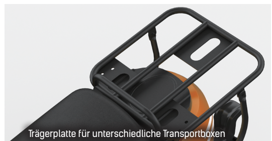
Trägerplatte für unterschiedliche Transportboxen