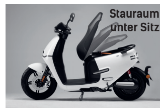
Stauraum unter Sitz